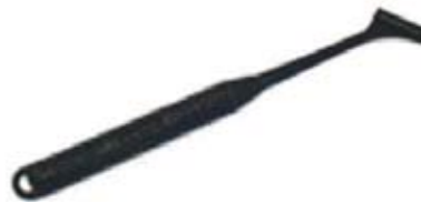
Hólkur til að losa flugu úr fiski án þess að þurfa að taka fiskinn úr vatninu eða skemma fluguna. Nauðsynlegt áhald ef menn ætla að sleppa bráðinni með lágmarksmeiðslum.

Á þessum slóðum er Moldá nýsloppin úr gríðarmiklu uppstöðulóni sem kennt er við bæinn Lipno. Lónið er hið efsta í röð nokkurra miðlunarlóna í ánni. Þar er miðstöð hvers kyns vatnaþróttu og útivistar og þangað safnast þúsundir ferðamanna þegar líður á sumarið.