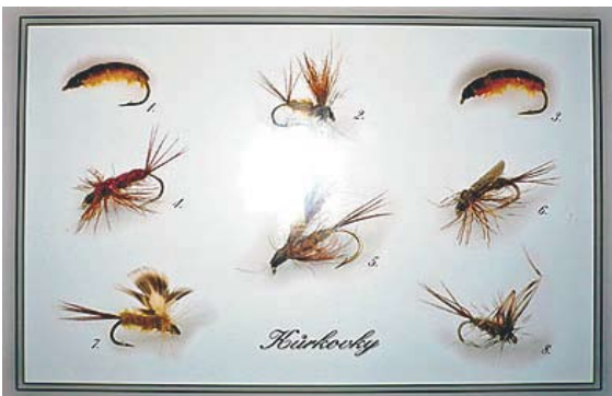
Kurkovsky, eða „Kúrkur“, eftir nafni húsbóndans. Girnilegar flugur fyrir íslenska urriða.

Þetta er eins og að fara á kastnámskeið, kennarinn kemur þegar hann sér að nemandinn gerir ekki rétt, sýnir aftur og aftur hvernig á að gera og stýrir handleggnum á rétta braut eða heldur í stöngina