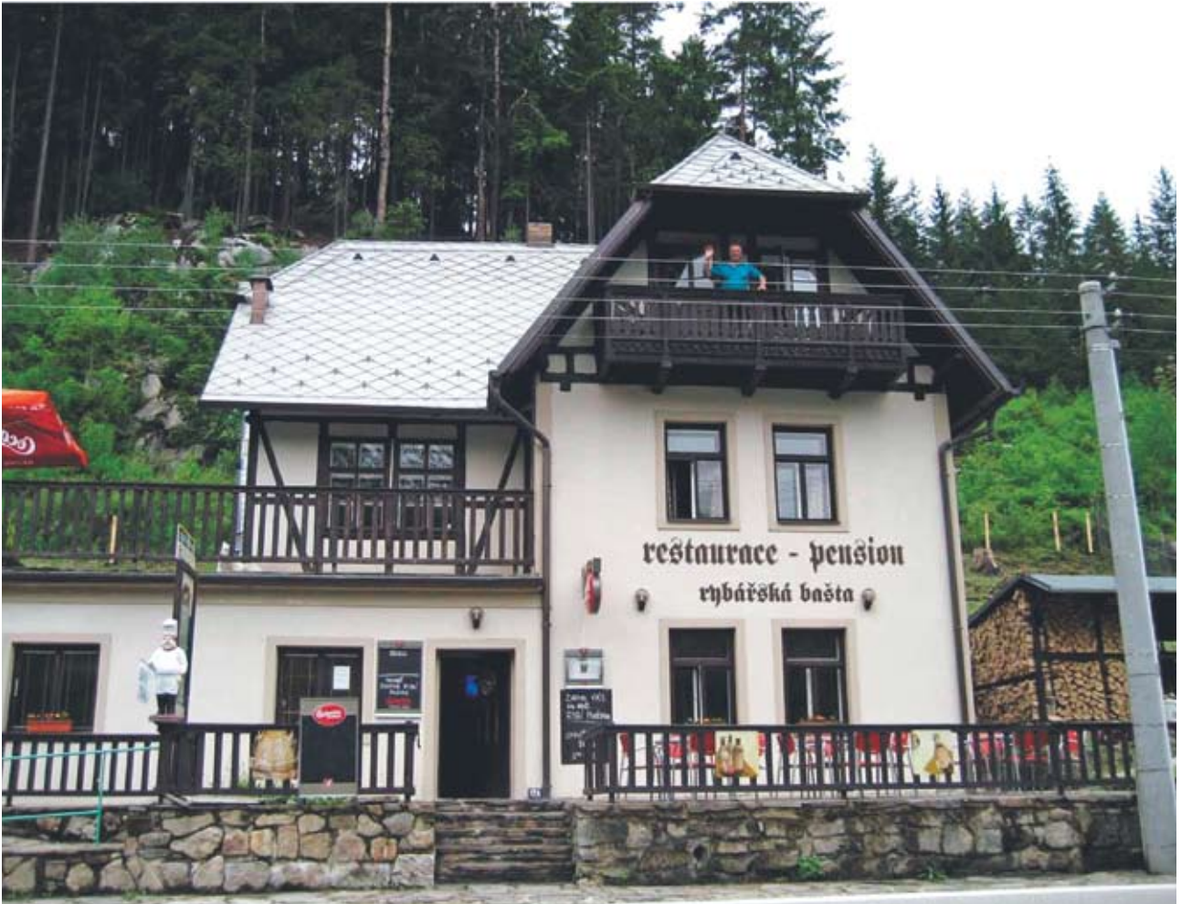
Veðiheimilið Rybárska bašta, heimili fluguveiðimanna. Morgunverðurinn var snæddur á pallinum.

Að veiða andstreymis. Eitthvað fannst mönnum dularfullt við þessa veiðiaðferð þegar fyrst heyrðist þískrað um hana fyrir allmörgum árum norður í Mývatssveit. Það fréttist af nokkrum sérvitringum sem veiddu andstreymis en flestum fannst þetta undarlegt og öfugsnúið, að standa nánast á tókustaðnum og henda flugunni rétt framfyrir fæturna á sér. Þegar flestir voru hæstánægðir með fjóra eða fimm fiska á vakt, veiddu andstreymismenn sjaldan færri en tólf. Ýmsir snjallir veiðimenn fóru að kenna okkur hinum þessa aðferð en með frekar litlum árangri. Það var svosem nógu auðvelt að skilja hvað átti að gera: kasta þungri púpu uppí strauminn – ekki endilega mjög langt - láta hana reka með botninum á eðlilegum straumhraða – og þá er‘ann á!